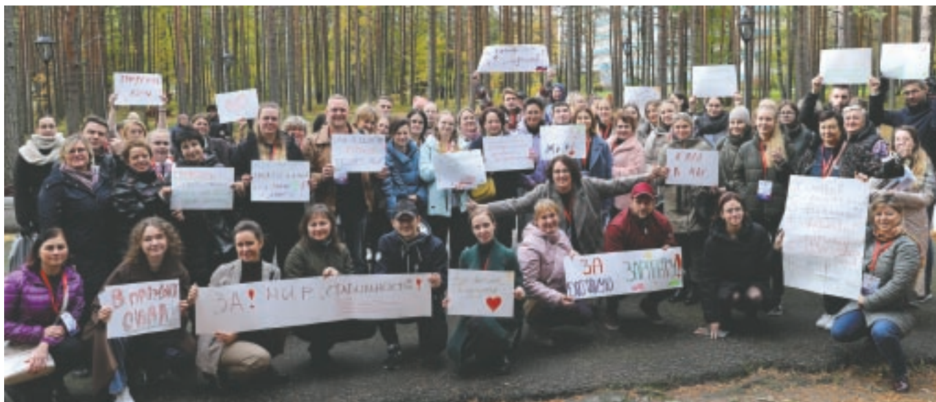
Флешмоб участников слета «Профсоюз. Новое поколение»